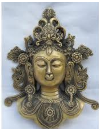
Kuan Yin, godin van mededogen (pagina 10)