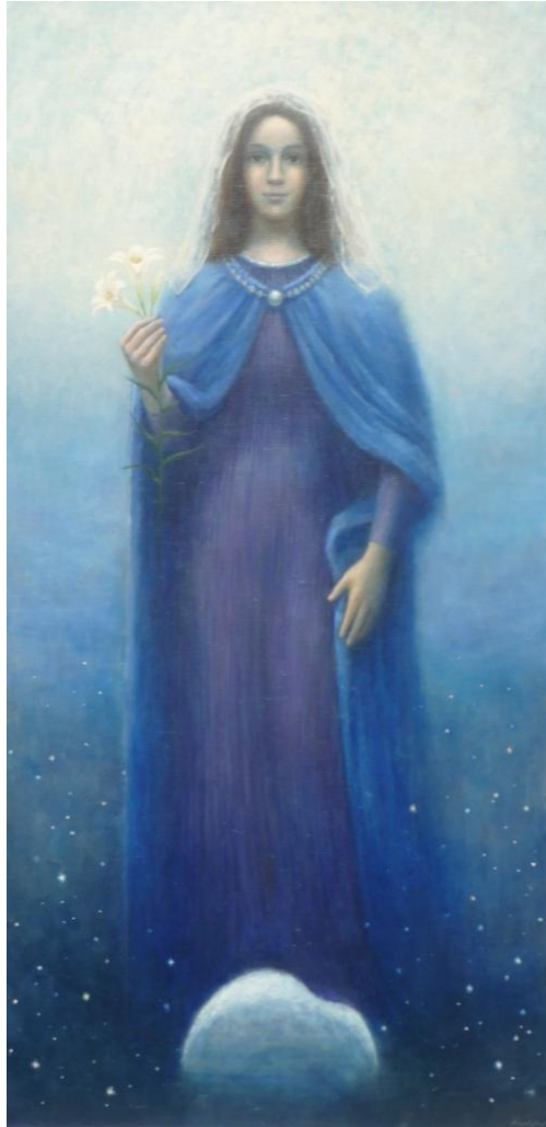
Sophia, Aya Sofia Istanbul